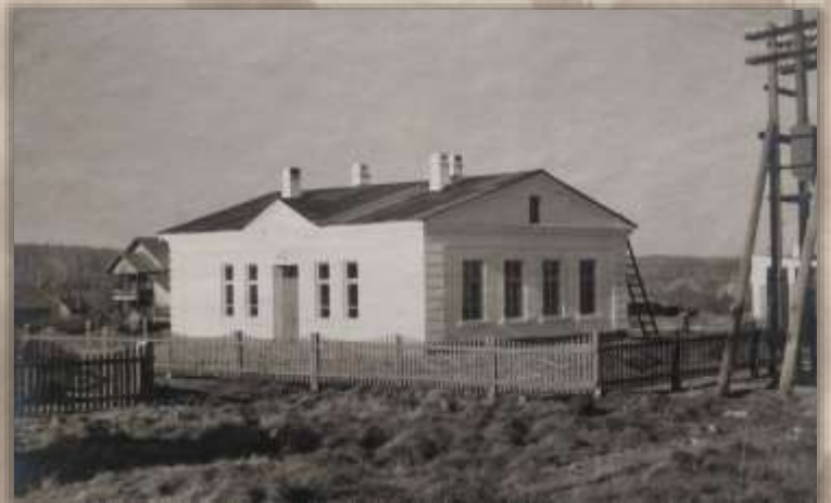
Дом связи. Ст. Таланджа.