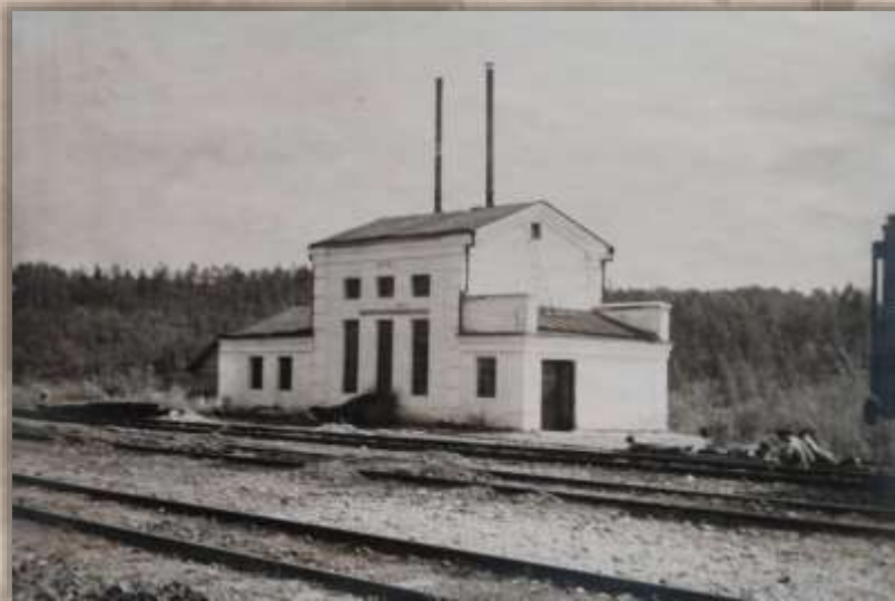
Насосная станция. Ст. Эхилкан.