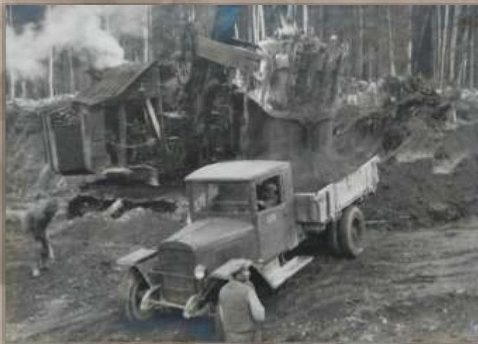
Погрузка грунта экскаватором.