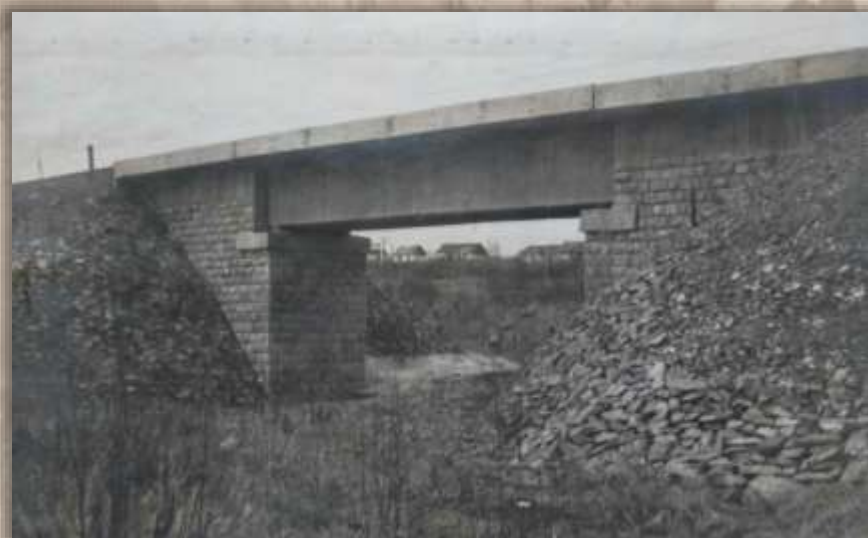
Мост. 219 километр.