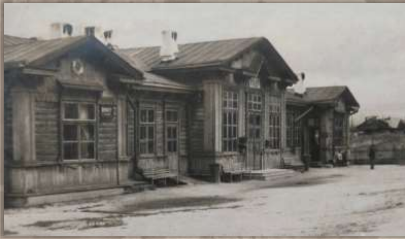
Пассажирское здание. Ст. Кульдур.