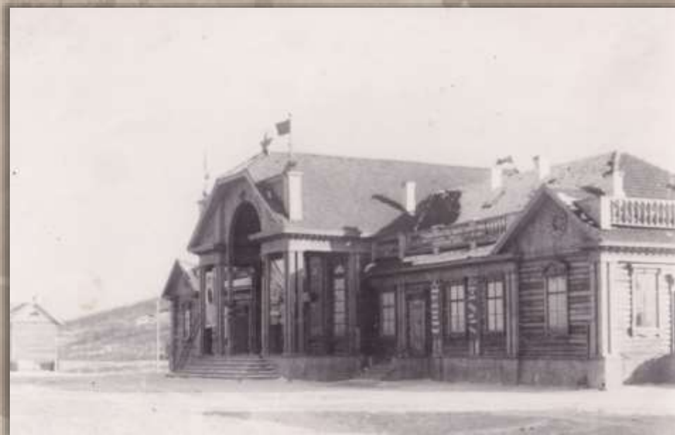
Ж. д. вокзал. Ст. Ургал. 1940-е гг.