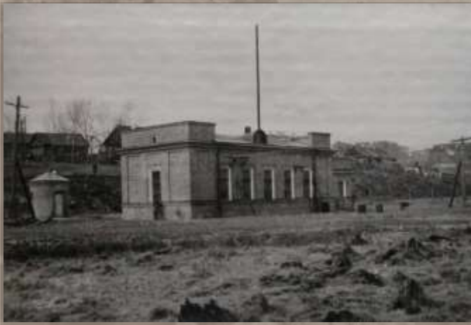
Насосная станция. Ст. Известковая.