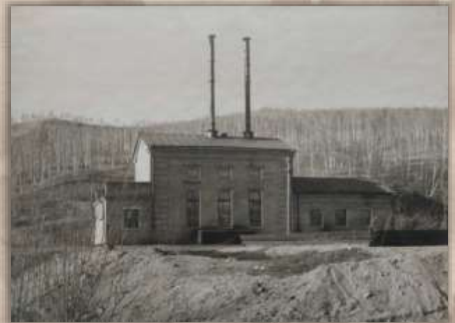
Насосная станция. Ст. Таланджа.