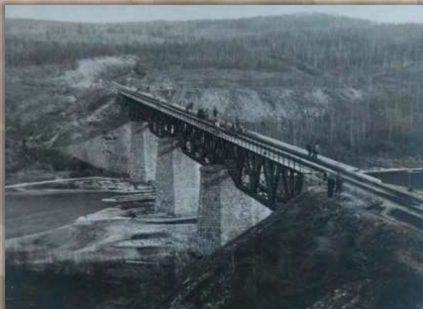
Мост. 188 километр.