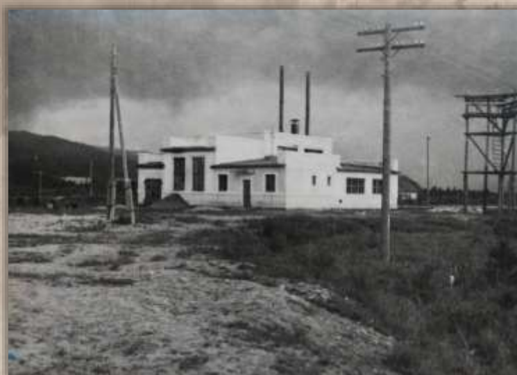
Электростанция. Ст. Кульдур.