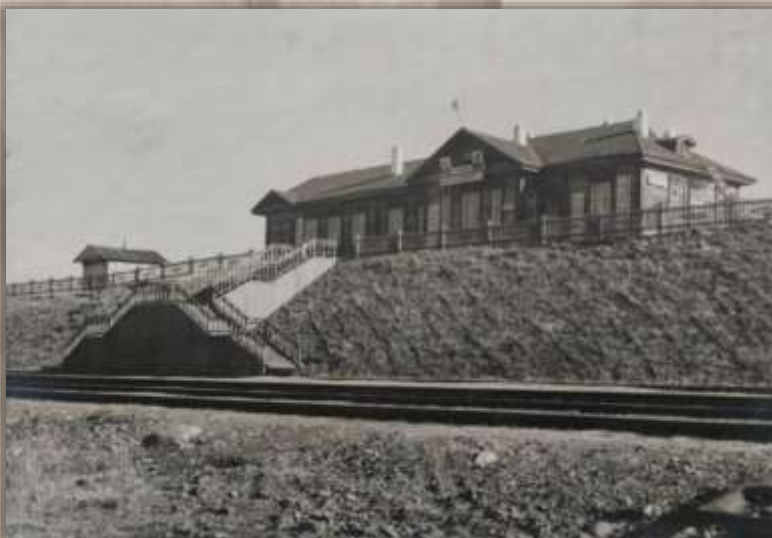
Пассажирское здание. Ст. Таланджа.