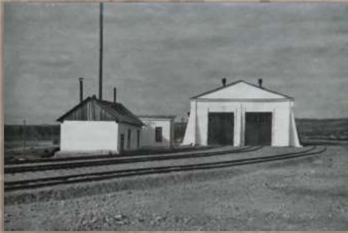
Депо. Ст. Известковая.