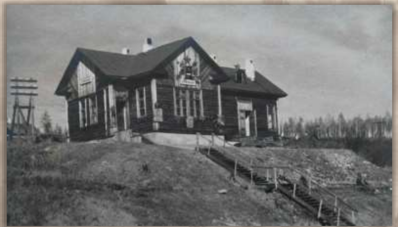
Пассажирское здание. Ст. Эхилкан.