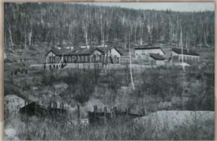
Путевой дом. 276 километр.