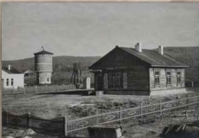
Родильный дом. Ст. Таланджа.