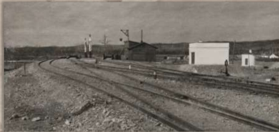
Гидроколлонка, пескосушилка и смазочное хозяйство. Ст. Известковая.