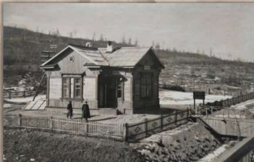
Пассажирское здание. Ст. Перевальный.