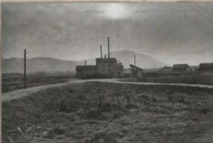
Насосная станция. Ст. Кульдур.