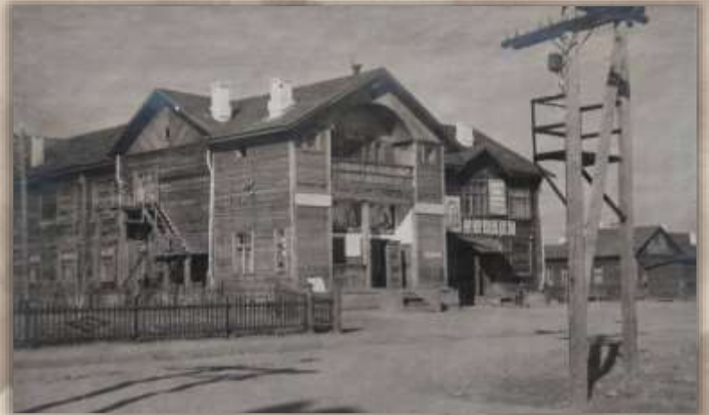
Клуб. Ст. Известковая.