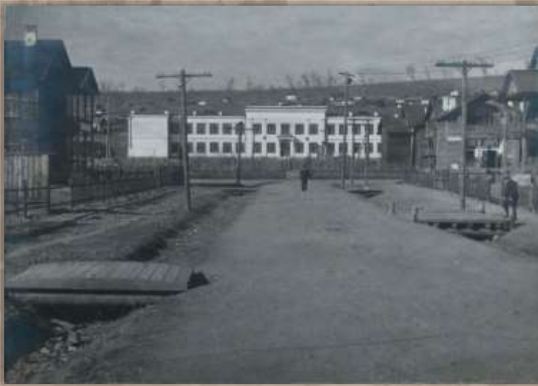
Улица к школе. Ст. Известковая.