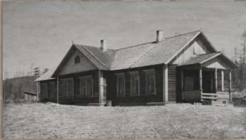
Жилой дом. Ст. Эхилкан.