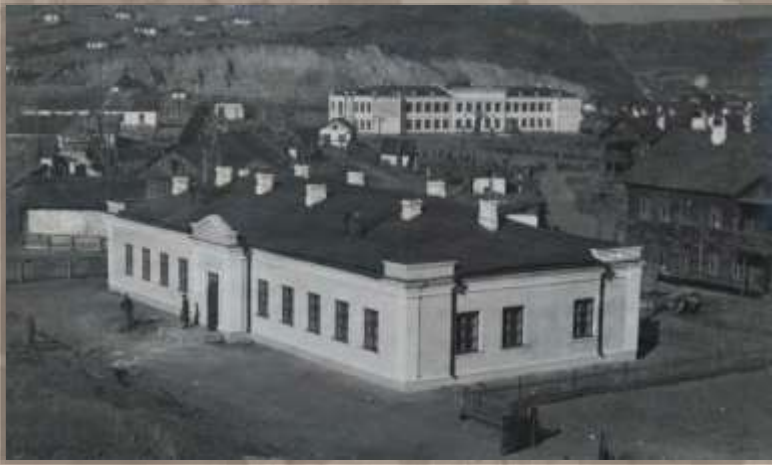
Дом связи и школа. Ст. Известковая.