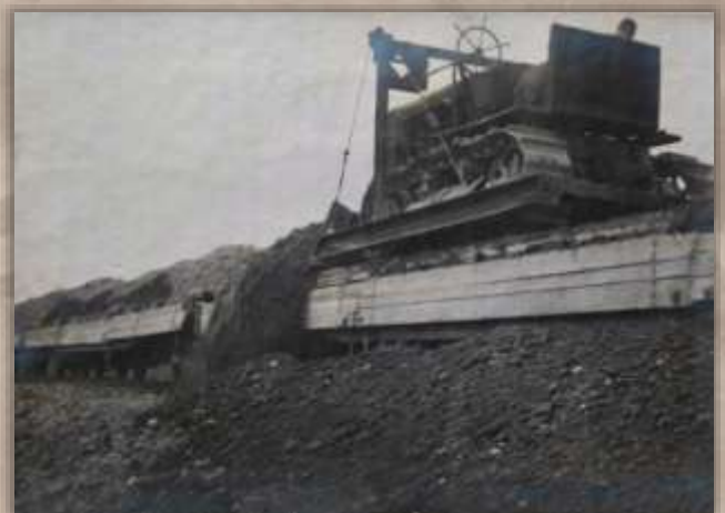
Разгрузка грунта бульдозером.