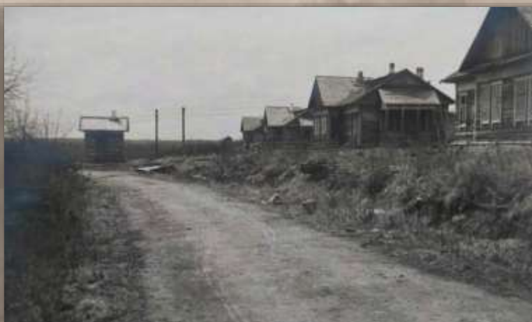
Жилой посёлок. Ст. Эхилкан.