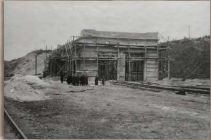
Строящееся депо. Ст. Кульдур.